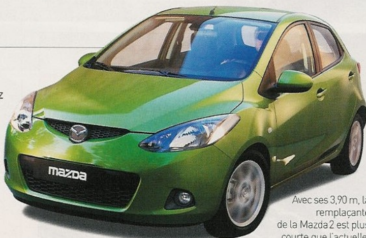
Avec ses 3,90 m, la remplaçante de la Mazda2 est plus courte que l'actuelle.

a été mis sur le dynamisme. C'est aussi à cela que servent les études qui se multiplient chez le constructeur japonais ! Avec une base qui sera partagée par la future Fiesta, la 2 se pose aujourd'hui clairement en rivale des Clio, 206 ou Grande Punto. Elle sera fabriquée au Japon, et non plus en Espagne.