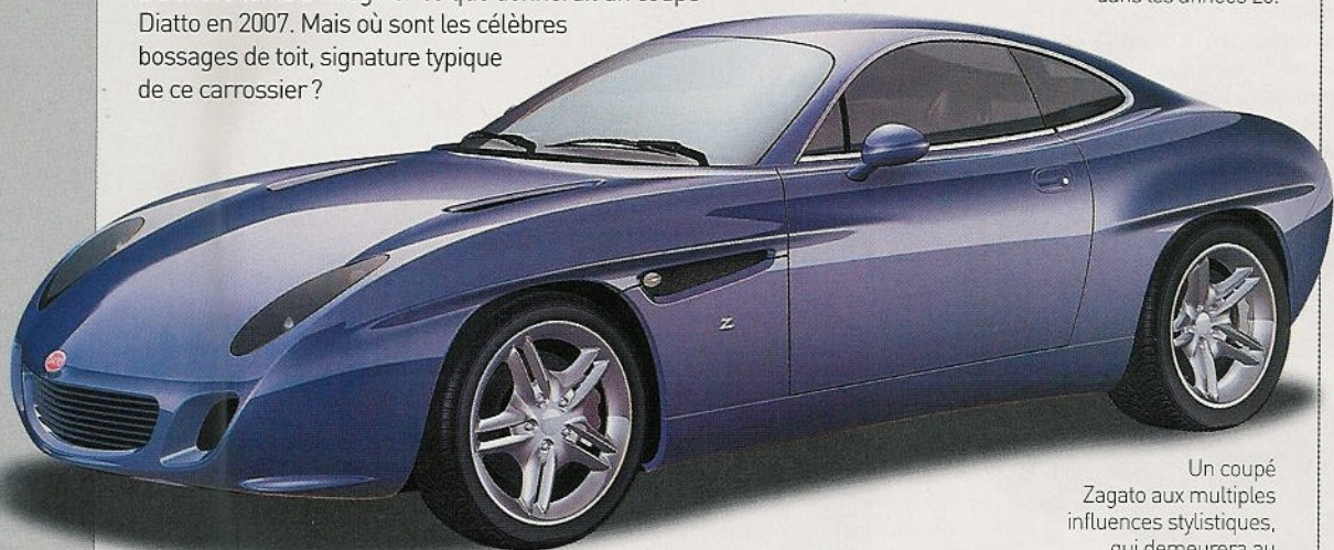
Un coupé Zagato aux multiples influences stylistiques, qui demeurera au stade de l'étude.