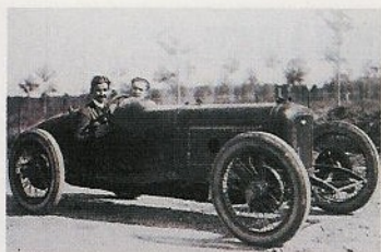
Diatto est une marque italienne qui s'illustra en course dans les années 20.

Un peu de nostalgie ne fait pas de mal, même si le lien entre le carrossier de Milan et Diatto est plutôt lointain. Diatto est une marque italienne née il y a 100 ans, qui fit courir dans les années 20 des voitures de 2 et 3 litres, préparées par Alfieri Maserati. Ugo Zagato fut sollicité par Diatto pour concevoir une carrosserie légère et aérodynamique. Créée à l'instigation de passionnés, l'étude présentée à Genève tente d'imaginer ce que donnerait un coupé Diatto en 2007. Mais où sont les célèbres bossages de toit, signature typique de ce carrossier ?